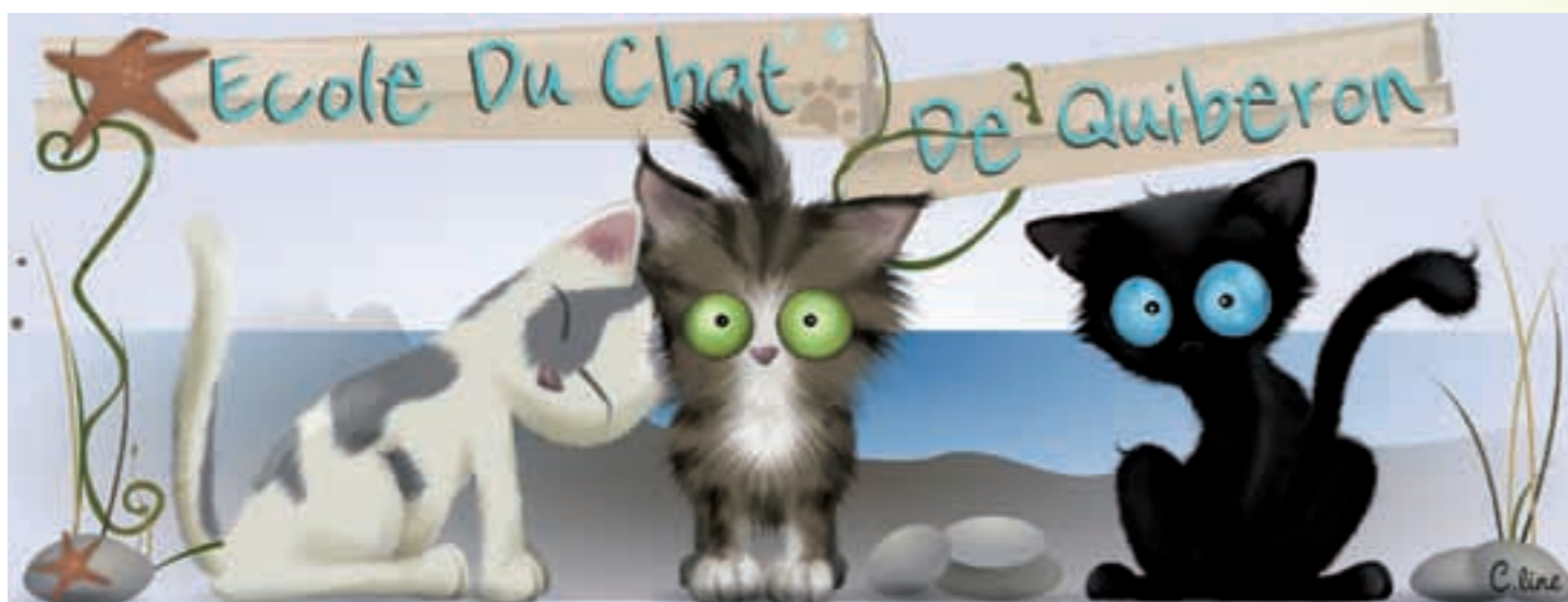
Bannière de l'association, créée bénévolement par Céline

faiement le caractère des chats que nous proposons à l'adoption ! Malheureusement, nous manquons cruellement de familles d'accueil ! J'en profite donc pour passer un appel à toutes les personnes habitant dans le Morbihan qui souhaiteraient se lancer dans l'aventure. L'association prend en charge tous les frais vétérinaires et d'alimentation et fournit également un parc pour l'accueil des chatons.