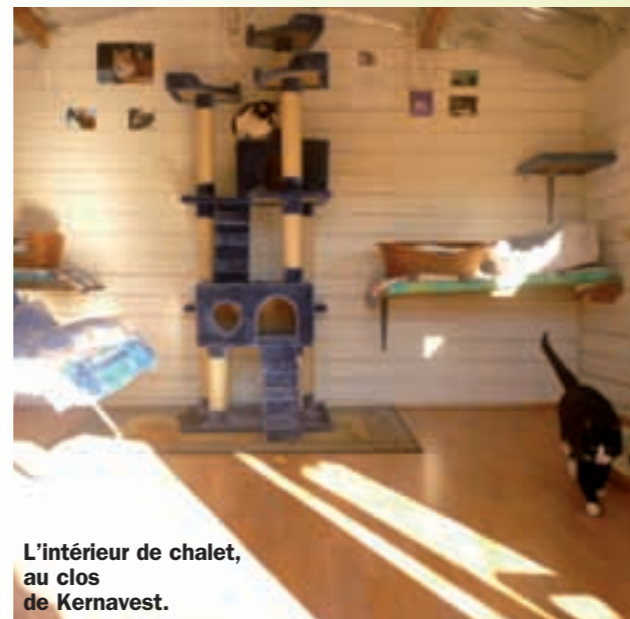
L'intérieur de chalet, au clos de Kernavest.

ATOUT CHAT (AC) : “POUVEZ-VOUS, EN QUELQUES MOTS, NOUS RACONTER L'HISTOIRE DE VOTRE ASSOCIATION ?”