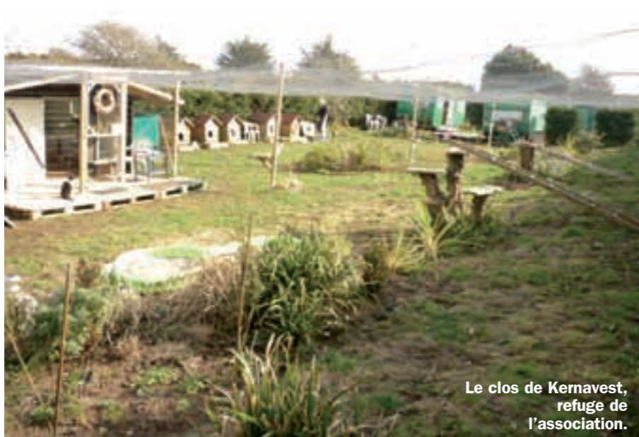
Le clos de Kernavest, refuge de l'association.